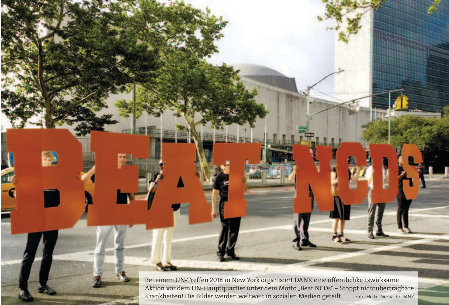
Bei einem UN-Treffen 2018 in New York organisiert DANK eine öffentlichkeitswirksame Aktion vor dem UN-Hauptquartier unter dem Motto „Beat NCDs“ – Stoppt nichtübertragbare Krankheiten! Die Bilder werden weltweit in sozialen Medien geteilt.