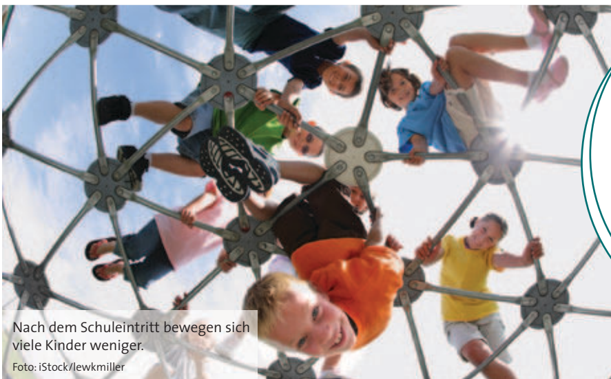
Nach dem Schuleintritt bewegen sich viele Kinder weniger.

In einem Programm wurden 500 Schulkinder über vier Jahre lang ermutigt, sich zu bewegen: durch viele Angebote im Schulalltag und Wissensvermittlung. Sie zeigten danach einen signifikant niedrigeren BMI als eine Vergleichsgruppe ohne Programm. Nur 4,2 % hatten Übergewicht entwickelt, gegenüber 9,8 % in der Vergleichsgruppe. Die Teilnehmer trieben häufiger Sport und verbrachten weniger Zeit vor TV und am Computer.