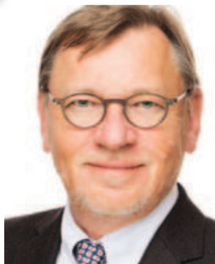
Ulrich Weigeldt Deutscher Hausärzterverband