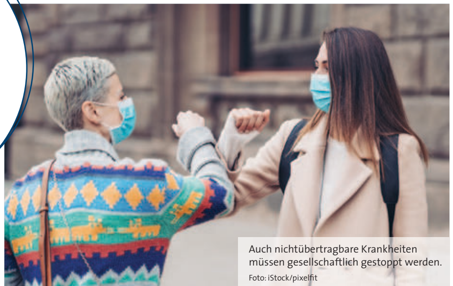
Auch nichtübertragbare Krankheiten müssen gesellschaftlich gestoppt werden.