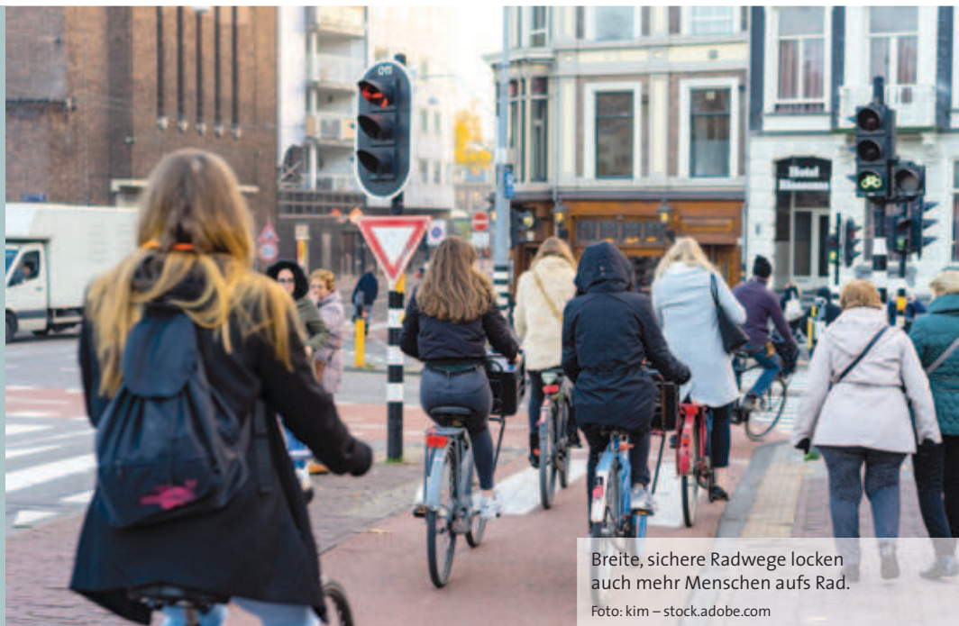
Breite, sichere Radwege locken auch mehr Menschen aufs Rad.

Breite Wege, sicher von der Fahrbahn für Autofahrer getrennt, oder gleich eigene Straßen nur für Radfahrer: Amsterdam ist ein Paradies der bewegungsfreundlichen Mobilität. Und das hat Wirkung: Der Anteil der Radfahrer ist seit 1995 um 40 % gestiegen, heute fahren 58 % der Amsterdamer täglich mit dem Rad. Zum Vergleich: In Berlin sind es nur 15 %, in Hamburg 22 %. Zugleich verunglücken Radfahrer in Amsterdam deutlich seltener.